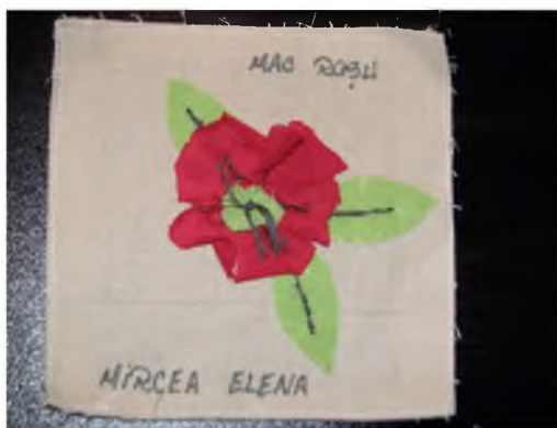
Foto: exemplu de petic

Ne dorim ca în 2014 să punem bazele unei arhive a comunității care să cuprindă povestiri, legende, istorioare, rețete de bucate și tot ce ține de cultura, istoria și farmecul zonei. Așadar, dacă vă doriți să nu pierdem o parte din istoria și cultura noastră, așteptăm cu drag un semn din partea dumneavoastră.